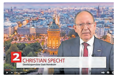
Oberbürgermeister Christian Specht

Ich weiß auch um die große Erschütterung, die der Terrorangriff am 7. Oktober in unserer jüdischen Gemeinde verursacht hat. Es ist vor allem die dadurch ausgelöste existenzielle Angst, sich als jüdische Bürgerinnen und Bürger nicht sicher zu fühlen und sich durch einen verschärfenden Antisemitismus tagtäglich bedroht zu sehen. Ich möchte deshalb an dieser Stelle jenen Moscheegemein-